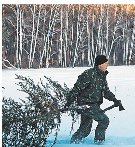
Из лесу елочку домой лучше не брать: можно заработать штраф.