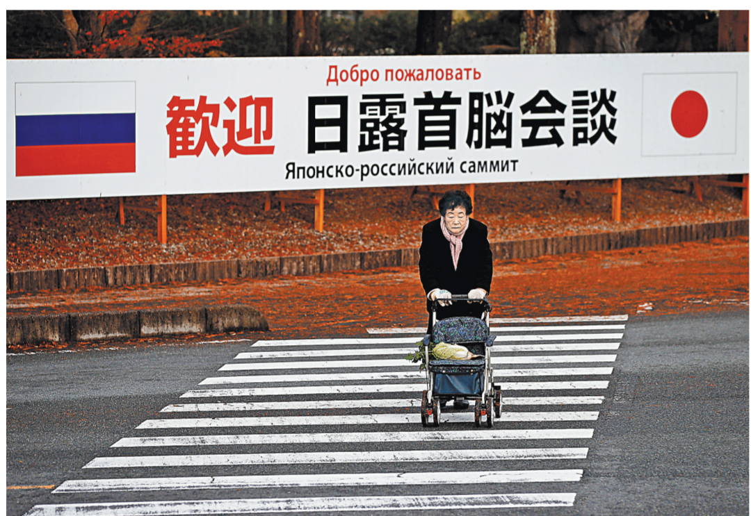
Россия и Япония наконец удалось сделать важнейший шаг на пути к заключению мирного договора.