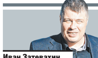
Иван Затевахин, телеведущий

СОГЛАСЕН, когда люди сходят с ума от желания поставить дома именно живую елку, лучше, чтобы для них она была выращена в каком-либо специальном питомнике. Иначе они пойдут в лес и спилят ее. Выращивание елок на продажу — это, на мой взгляд, наименьшее из зол. «РГ» на 1-й и 9-й полосах пишет, что в эти выходные по всей стране стали открываться елочные базары.