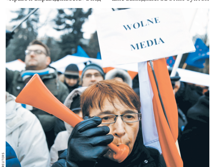
Поляки вышли на улицы, чтобы отстаивать свое право на свободные СМИ.

рыве конституционных основ, ужесточении цензуры СМИ и ущемлении интересов поляков. Эти претензии поддерживают и тысячи жителей Варшавы, Кракова, Гданьска, Люблина и Быдгощи, которые вышли на акции в минувшие выходные. За этим бунтом